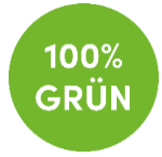
Strom von AECO

Die Tarifkarte ist ein integraler Bestandteil Ihres Liefervertrags mit AECO.